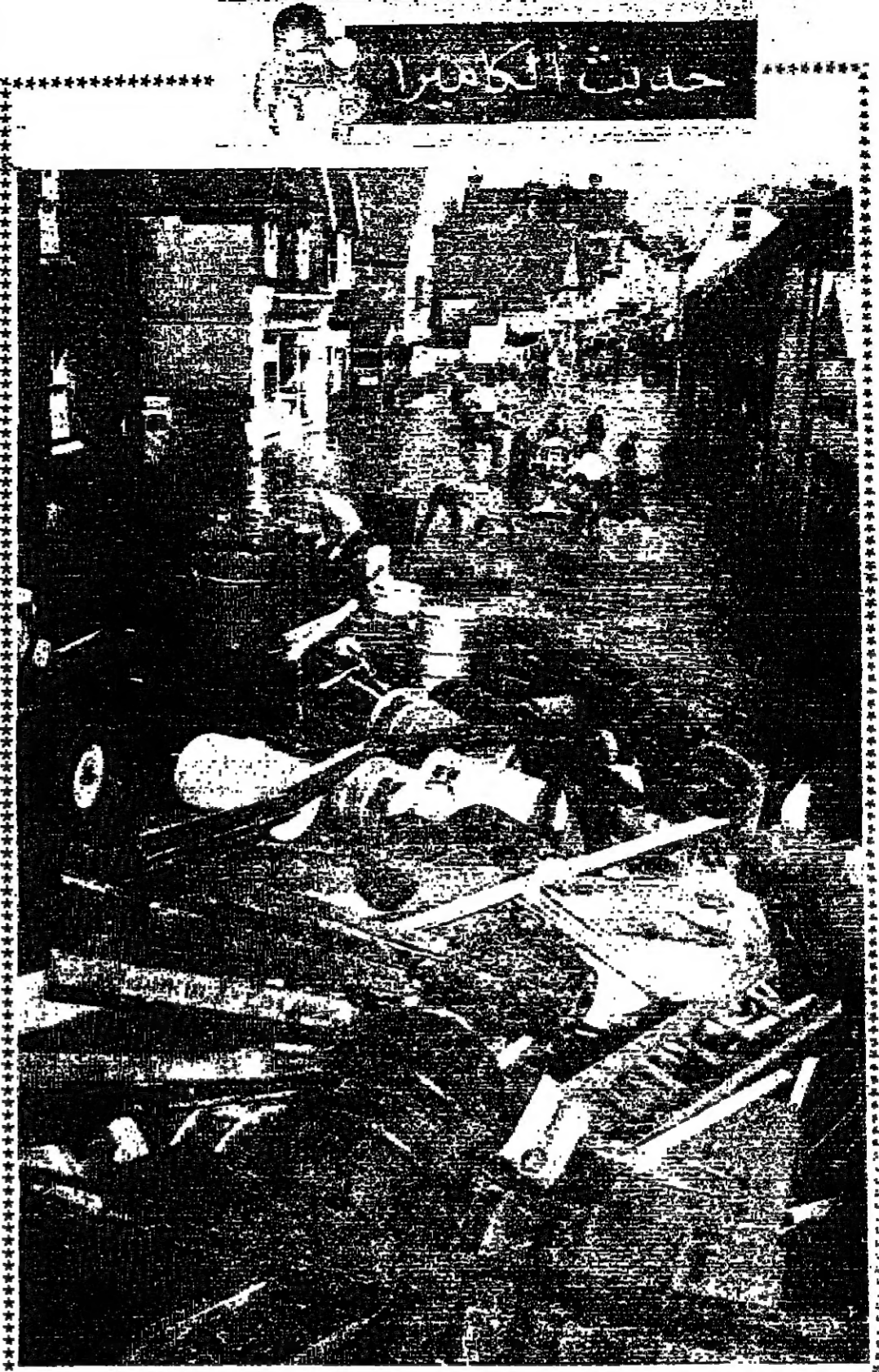
خلف السيل العرم الذي داهم مدينة ارب وبرد في مقاطعة كنت ببريطانيا عندما طفت مياه نهر اربن وفاضت على شاطئيه كمية كبيرة من المواد كان معظمها براميل كيمياويات ومن دمجها تعرضت بشكركرئيسي الى قوة مياه الفيضان وقد طفت المياه على شوارع المدينة وحوطتها الى انهار حقيقية

يشرف باعلام الجمهور الكريم بأنه سيتابع تدريسي اللغة الفرنسية اعتبارا من تاريخ ٣٠ ايلول ١٩٦٨ الساعة الثالثة والنصف بعد الظهر. يبدأ التسجيل بتاريخ ٢٢ ايلول من الساعة العاشرة صباحا حتى الواحدة ظهرا ومن الساعة الرابعة حتى يسال الساعة ثلثون ٣٧٠٠٩